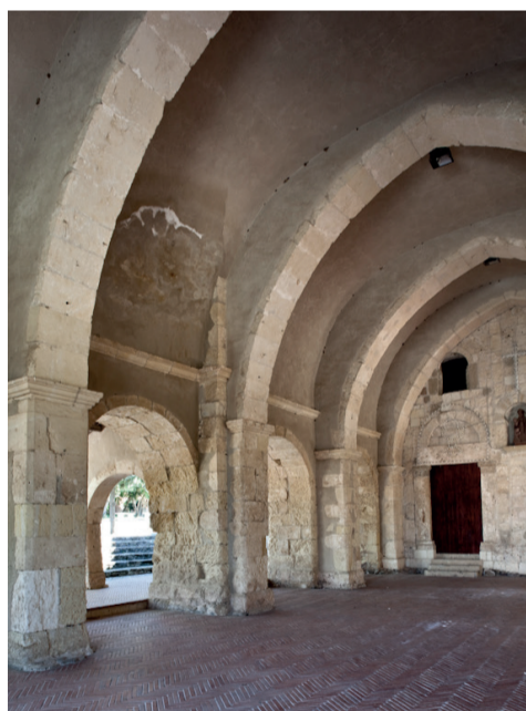
San Gemiliano Loc. San Gemiliano

Visite guidate a cura del Comitato Festeggiamenti San Gemiliano 2025 e dell'Istituto Comprensivo Gramsci+Rodari di Sestu