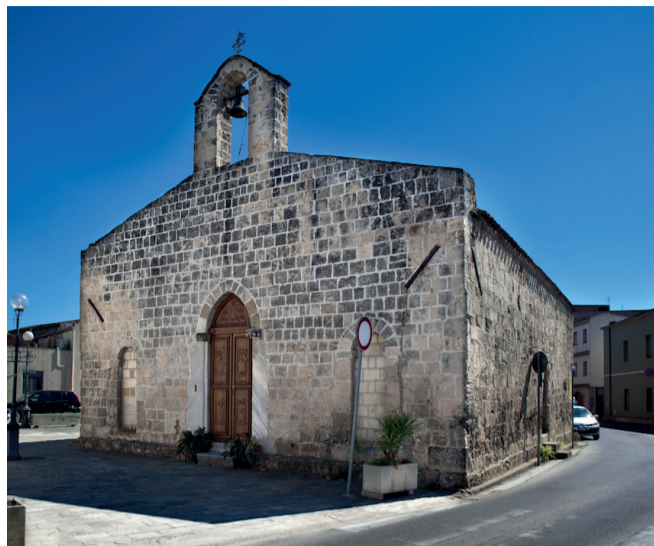
Chiesa di San Salvatore Piazza San Salvatore 8

La chiesa di San Salvatore sorge nel centro storico di Sestu ed è stata realizzata tra il XII e il XIII secolo. L'edificio è realizzato in calcare e arenaria e presenta una copertura a capanna con un campanile semplice. All'ingresso presenta un portale ligneo ad arco a sesto acuto affiancato da due strutture ad arco a tutto sesto, al posto delle quali si aprivano, in corrispondenza delle navate, altri due ingressi alla chiesa. All'interno ha tre navate con volta a botte e abside semicircolare. La Chiesa viene utilizzata durante le celebrazioni del SS Salvatore che ricorre alla fine del mese di luglio.