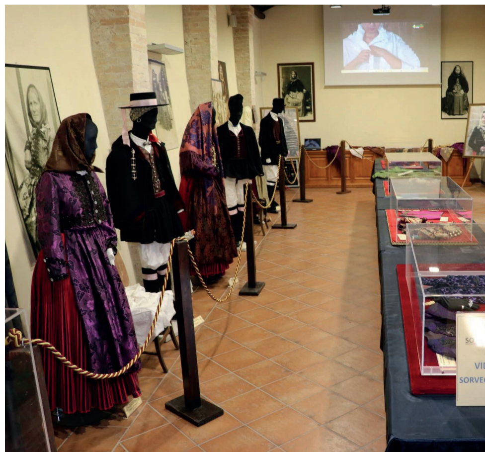
Casa Ofelia Via Parrocchia 88

Tra gli edifici tardo-gotici della Sardegna meridionale, la parrocchiale di San Giorgio è uno dei più interessanti: terminata nel 1567, presenta una facciata a terminale orizzontale con merlatura. Lo spazio interno è a navata unica fiancheggiata da cappelle in stile gotico con volta a sesto acuto. Il presbiterio è più basso e stretto della navata con base quadrata, la cui volta a crociera presenta una grossa gemma pendula alla chiave di volta. Elementi pregevoli sono il rilievo con San Giorgio a cavallo e il Cristo in croce nella gemma centrale dell'ultima cappella a sinistra, sul modello del Crocifisso di Nicodemo di Oristano. In corrispondenza dell'ingresso laterale è conservato l'antico miliario romano (epoca di Settimio Severo), all'origine del nome del moderno abitato. San Giorgio è il Patrono, la cui ricorrenza ricade il 23 aprile.