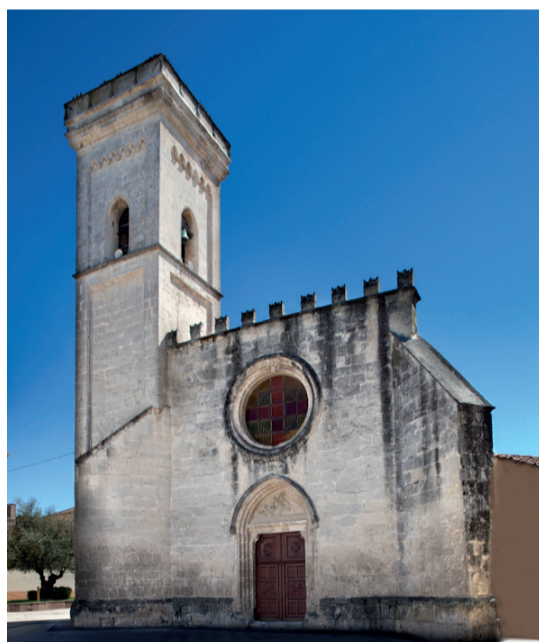
Chiesa di San Giorgio Via Repubblica 7

La chiesa di San Gemiliano sorge a Nord dell'abitato, da cui dista cinque chilometri circa. Costruita nella seconda metà del XIII secolo, apparteneva al villaggio scomparso di Sussua. La pianta è rettangolare, composta da due navate affiancate, munite di separati ingressi e distinte absidi; le navate sono separate da archi su pilastri e coperte da volte a botte impostate da archi trasversali. San Gemiliano si differenzia dalle altre simili edificate nel meridione dell'isola per l'inversione dei rapporti di larghezza delle navate e di ampiezza delle rispettive absidi. Infatti a San Gemiliano è maggiore la navata a settentrione. Nel XVII secolo alla chiesa venne aggiunto un portico a giorno diviso in tre navate; sul fianco sinistro venne aggiunta la sacrestia e l'alloggio per l'eremita, ossia il guardiano della stessa.