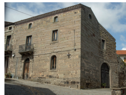
Museo Etnografico "Le Cose della Vita" in Casa Tatti Piazza San Damiano

La chiesa dei Santi Cosma e Damiano, edificata nel 1155, è collocata nella periferia di Ardauli. Ha un impianto a navata unica divisa in quattro campate da paraste e archi a tutto sesto. Il presbiterio è sopraelevato di 1 gradino rispetto alla navata. Le murature, in pietrame misto, sono intonacate e tinteggiate, gli archi e le paraste in pietra faccia a vista.