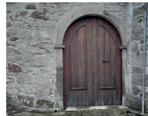
Porzione di casa padronale del 1800 Via C. Battisti 25

Casa tipica ardaulese del 1700, appartenente alla famiglia Ibba