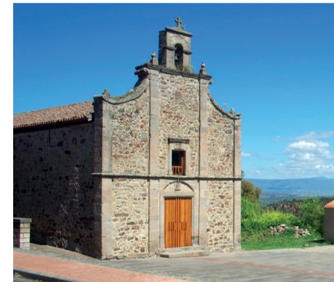
Chiesa dei Santi Cosma e Damiano Piazza San Damiano

La chiesa, iniziata nel 1620 e terminata nel 1680, risponde ai moduli sardo-catalani, con alcuni influssi gotici, come dimostra il rosone in trachite rossa della facciata. La facciata, molto sobria in apparenza, è ricchissima di motivi ornamentali. All'interno della chiesa si trova scolpita sulla trachite la scena di Adamo ed Eva nel Paradiso Terrestre. L'impianto della chiesa è a navata unica, fiancheggiata da otto cappelle. Il campanile è di costruzione più recente, come testimonia l'iscrizione posta sull'architrave della porta d'ingresso (1812).