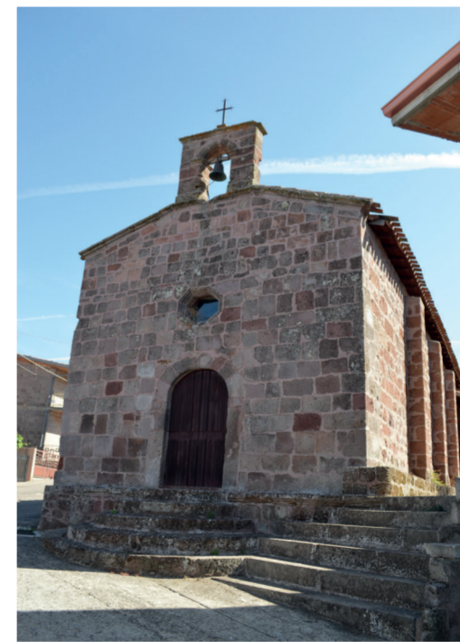
Chiesa di San Michele Via San Michele

Visite a cura di studenti, volontari e associazioni del territorio