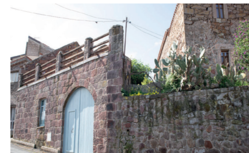
Casa contadina del 1800 Via Fiume 1

Casa tipica ardaulese del 1800, appartenente alla famiglia Urru.