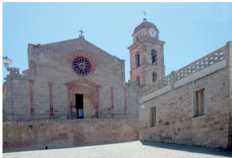
Chiesa della Beata Vergine del Buon Cammino Via Brigata Sassari

Visite a cura degli studenti delle Scuole Medie