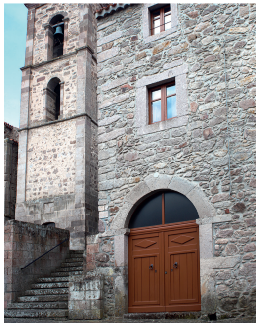
Casa tipica ardaulese Via San Damiano 12

Casa tipica ardaulese del 1900, costruita dalla famiglia Carta. All'interno della casa una stanza era adibita a ufficio postale e telegrafo.