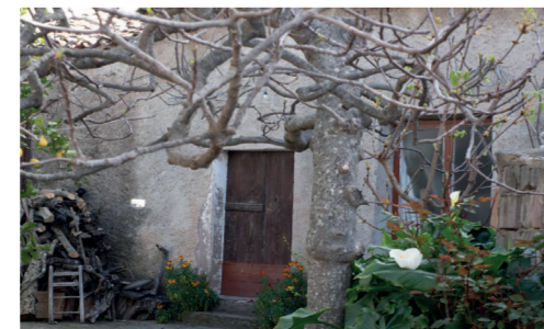
Casa contadina del 1700 Via Umberto 32

Il mulino per grano della seconda metà dell'800.