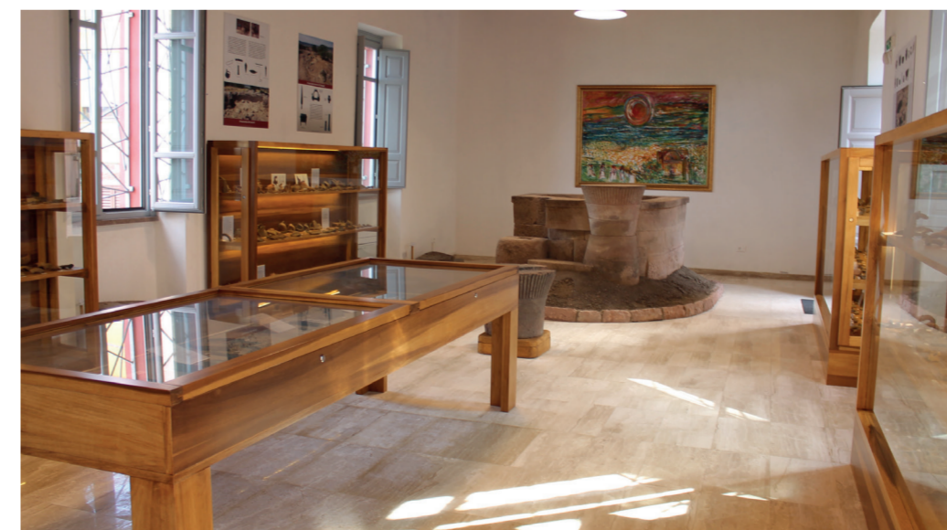
Mostra archeologica "Su Monte" Via San Michele c/o ex Casa del Fascio

chiesa è a navata unica con tetto a capriate lignee di recente ricostruzione. L'unico ricordo dell'antico edificio si trova sulla parete di fondo del presbitero dove sorge una nicchia rinascimentale, che presenta al suo interno la statua di San Michele, databile intorno al XVIII secolo. Secondo i documenti dell'archivio parrocchiale, la Chiesa è stata l'oratorio della Confraternita della Santa Croce. La novena in onore di San Michele si svolge dal 20 al 28 settembre.