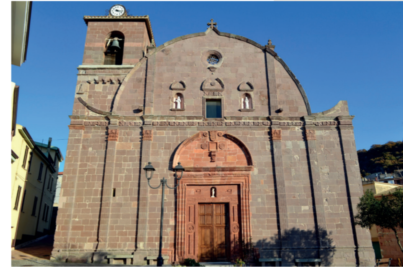
Chiesa di San Sebastiano Via San Sebastiano

Casa tipica ardaulese del 1800, appartenente alla famiglia Pinna