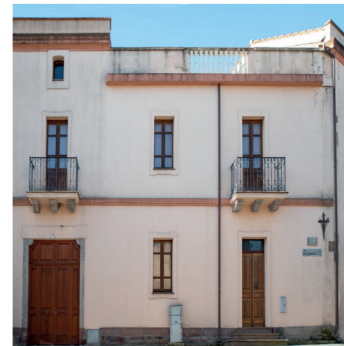
Mulino di Casa Tatti Via Fra Tommaso 131

Casa tipica ardaulese del 1900, costruita dalla famiglia Carta. All'interno della casa una stanza era adibita a ufficio postale e telegrafo.