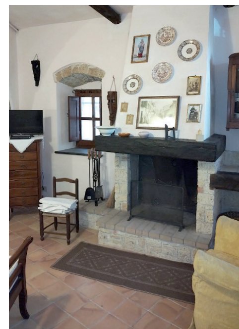
Casa Cocco Via Garibaldi 11