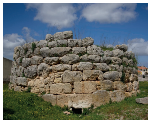
Villaggio Nuragico Sa Mandra 'e sa Giua

aratri, finimenti degli animali da tiro e da soma. Nell'unica stanza al pianterreno il percorso prosegue con l'esposizione degli oggetti utilizzati per la lavorazione dei prodotti della campagna, di antichi pesi e misure, di attrezzi per la produzione di formaggio, vino e olio. Al piano superiore, in quattro distinti locali, sono stati ricostruiti, con mobili e oggetti d'epoca, la cucina e la camera da letto, ossia le stanze che costituivano gli unici locali dell'abitazione contadina, una stanza di disimpegno (s'appositu) dove le massaie cucinavano e ricevevano gli ospiti. In un quarto locale si passano in rassegna tutti gli attrezzi utilizzati dal falegname, il fabbro e il calzolaio che risultano essere i mestieri più attestati ad Ossi.