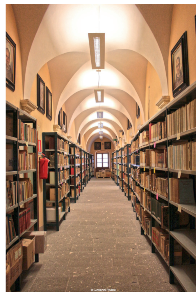
Biblioteca Provinciale Franciscana di San Pietro di Silki Via Sassari 52

Visite a cura dell'Istituto comprensivo di Ittiri