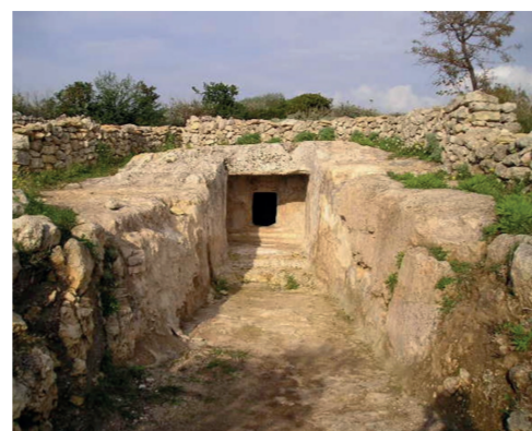
Domus de janas di Littos Longos

Il sito nuragico sorge nella periferia est del paese, nel rione di Litterai. La superficie recintata comprende un villaggio di capanne che circondano il nuraghe, dove è visibile la torre centrale. Il nuraghe è composto da una torre centrale più antica, edificata tra il 1400 e il 1300 a.C. Ai lati della torre vennero costruite due torri più piccole delimitate da un piccolo cortile. La parte più importante si trova a circa 30 metri dal nuraghe: è composta da cinque capanne articolate in più vani, raccordati in uno spazio centrale. Uno di questi è denominato "Casa del pane" e si tratta di un piccolo ambiente circolare, circondato da sedili e vasche rettangolari. In questo spazio è presente un forno adiacente alla rotonda che in origine doveva essere coperto da un tetto conico.