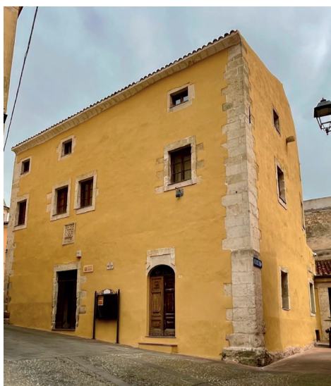
Palazzo baronale (museo etnografico) Via Statuto 3

Come arrivare: dall'ingresso del paese, percorrere via G.L. Serra, svoltare a sinistra e percorrere in salita via Pio X sino a via Statuto.