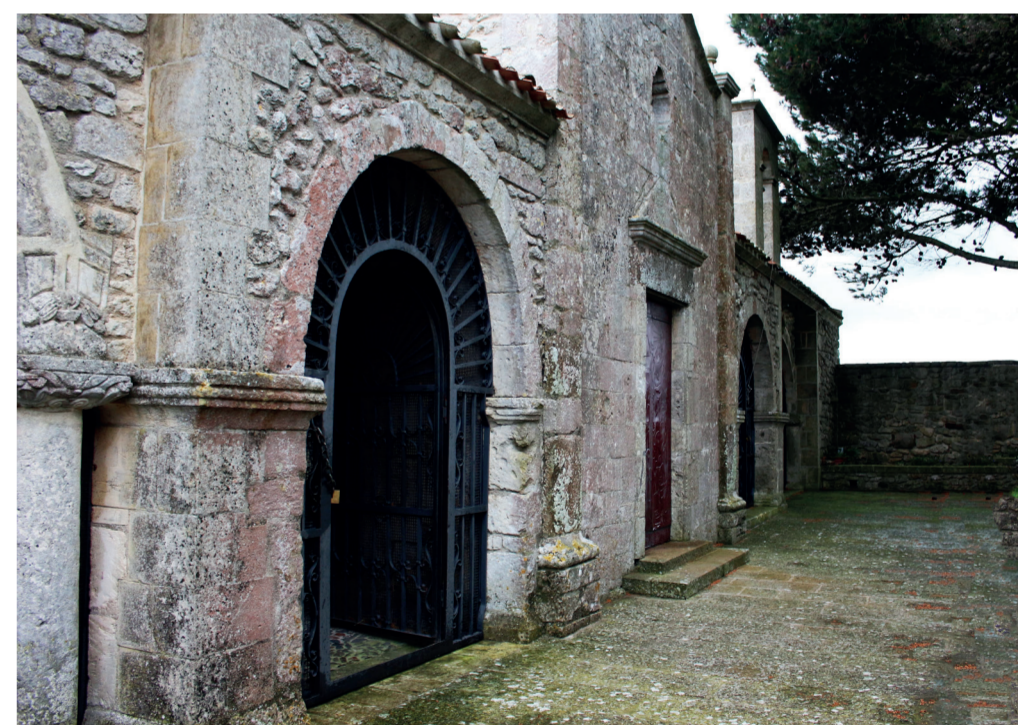
Chiesa di Nostra Signora di Coros Loc. NS di Coros (Altipiano di Sas Seas, 4km circa dal paese)

1610 e il 1707, che richiama l'architettura tipica dei conventi e ha subito un lungo lavoro di restauro negli ultimi anni. Ancora oggi all'interno sono visibili le grandi arcate che formavano il chiostro mentre sulle pareti sono sistemati gli scaffali con i tanti libri consultabili. I locali sono attigui alla chiesa di San Francesco che governa una delle due parrocchie di Ittiri, l'altra è quella di San Pietro in Vincoli. Il corpus librario è uno scrigno di inestimabili tesori di carta: ottantamila volumi, fra i quali circa 114 cinquecentine (al momento non visibili al pubblico), volumi del Seicento e del Settecento. Ma anche tanti i libri dell'Ottocento e quelli moderni.