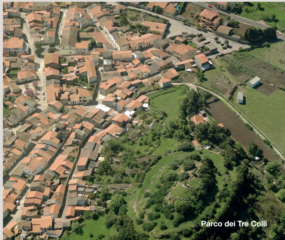
Parco dei Tre Colli

A fine visite compila il nostro questionario. La tua opinione è importante per noi!