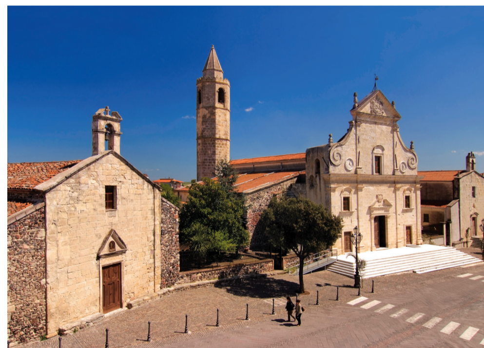
Oratorio di Santa Croce 4 Piazza San Pietro

Visite guidate a cura delle classi IV B e II B – Scuola Primaria Istituto Comprensivo Satta-Fais