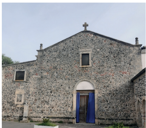
Chiesa di Sant'Antonio da Padova 2 Piazza del Convento – via Pietro Salis