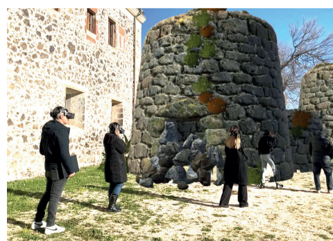
Ex Convento dei Cappuccini e Mostra Multimediale "Giovanni Spano" 3 Piazza del Convento – via Pietro Salis

Sul lato sinistro presenta l'ingresso a quelli che erano i locali di servizio del convento annesso alla chiesa e, sul lato destro, l'antico porticato esterno (portaria), con le arcate murate, all'interno delle quali i frati alloggiavano e prestavano assistenza ai pellegrini e ai mendicanti. All'interno della chiesa, a navata unica, sul lato sinistro si aprono tre cappelle dedicate rispettivamente alla Madonna del Rimedio, a S. Francesco d'Assisi e al Crocifisso (aggiunta dopo il 1736 con il nome di Santa Maria del Monte Carmelo).