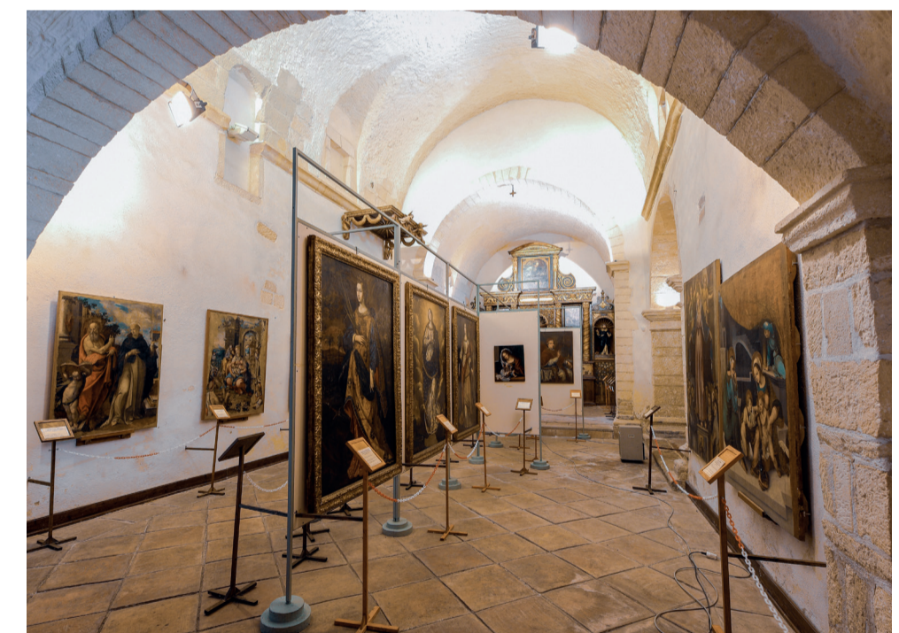
Oratorio del Rosario e Pinacoteca "Giovanni Spano" 5 Piazza San Pietro