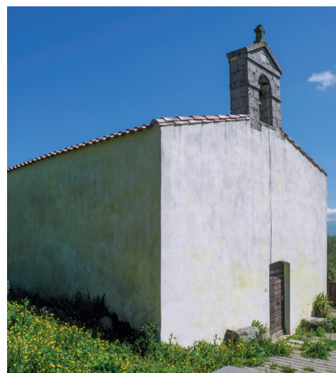
Cimitero Antico Piazza San Pietro