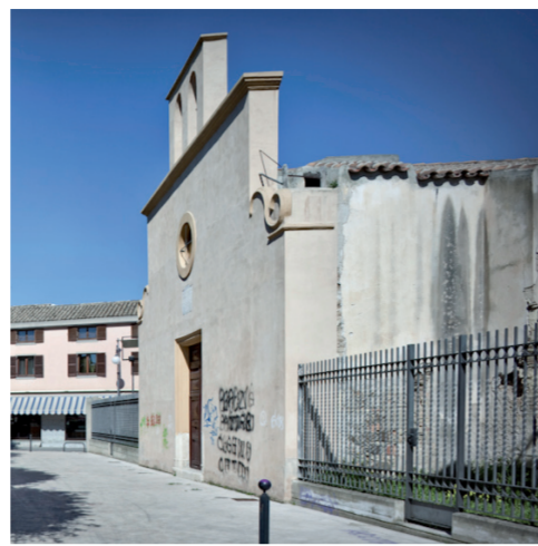
Chiesa e Sacrestia di Sant'Efisio Piazzetta Sant'Efisio

L'edificio ha subito nel tempo ampie manomissioni, con un importante intervento di restauro nel 1960. L'esterno ha un terminale classicheggiante sottolineato da modanature presenti anche nell'oculo ottagonale, di stile barocco, che sovrasta la semplice porta rettangolare. L'interno ha un'unica navata voltata a botte, ai lati della quale si aprono delle piccole cappelle: due a destra e una a sinistra, con una traccia dell'arco d'ingresso di una quarta, probabilmente demolita quando, tra gli ultimi decenni del '700 e i primi dell'800, venne modificata la Basilica di Sant'Elena. Una porta collega l'Oratorio con la parrocchiale all'altezza della prima cappella a sinistra.