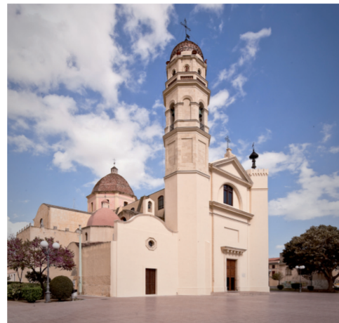
Basilica di Sant'Elena Piazza Sant'Elena

cappella per un ricovero di vecchi abbandonati. Nel 1985, il convento fu abbandonato e la chiesa fu affiliata alla parrocchia di Sant'Elena. La chiesa ha una modesta facciata a capanna e una sola navata con volta a botte. Conserva pochi arredi antichi, tra cui una pregevole pala del '600 attribuita al pittore Orazio de Ferrari.