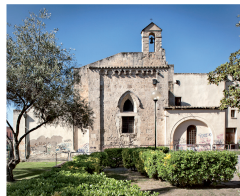
Chiesa di Sant'Agata Piazza Azuni