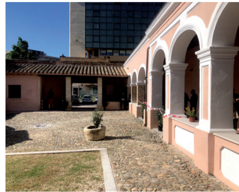
Casa Museo Sa Dom'e Farra Via Umberto I

L'edificio cappuccino sarebbe stato costruito sulle rovine di un preesistente monastero di origine vittoriana. Il Convento di Quartu, costruito secondo lo stile architettonico cappuccino, presenta somiglianze con i primi due conventi dell'ordine a Cagliari. Situato vicino alla Chiesa di Sant'Agata, confina con la piazza Matteotti, la via Brigata Sassari e la piazza Azuni. L'edificio