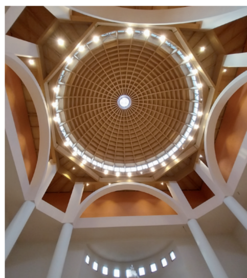
Chiesa di San Giovanni Evangelista Via Pitz'e Serra

L'interno è composto da una sola navata con una volta a botte e tre sottarchi a tutto sesto. Ci sono due cappelle laterali e un presbitero con una cupola ottagonale. Il collegamento tra la navata e il presbitero è realizzato attraverso un arco trionfale a tutto sesto. I contrafforti ospitano due cappelle aggiunte in seguito. Gli arredi includono una campana del 1717, un pulpito ottocentesco e un gruppo scultoreo raffigurante S. Bonaventura e la confraternita di Sant'Efisio. Ci sono anche piccole statue lignee e nicchie roccòc con le statue dei santi patroni.