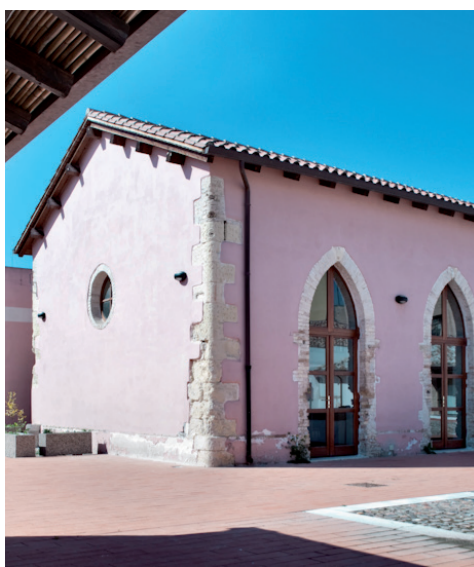
Antico Macello – Biblioteca e Archivio Storico Via Dante 68

Visite guidate a cura di Liceo Classico, Linguistico e delle Scienze Umane “B.R. Motzo” e Arcoiris OdV ETS