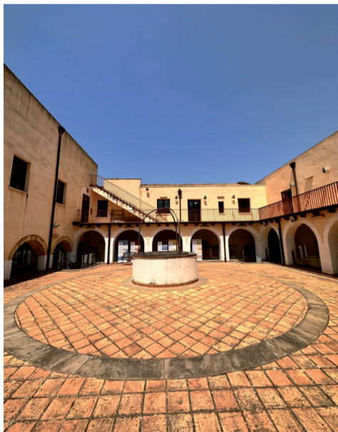
Ex Convento dei Cappuccini Via Brigata Sassari 4

Il progetto originale dell'Antico Macello, a opera dell'ingegnere A.F. Loi, subì alcune modifiche a causa di un nubifragio nel 1889, ma mantiene una semplice eleganza e una funzionalità rispondente alle norme igieniche dell'epoca. La struttura si sviluppa simmetricamente rispetto a un asse centrale e presenta una facciata con un cancello d'ingresso in ferro battuto, finestre per gli uffici e una sala di macellazione con porte chiuse per mantenere la carne fresca. Intorno all'edificio c'erano corti e tettoie per il bestiame e una pelandra per conciare le pelli.