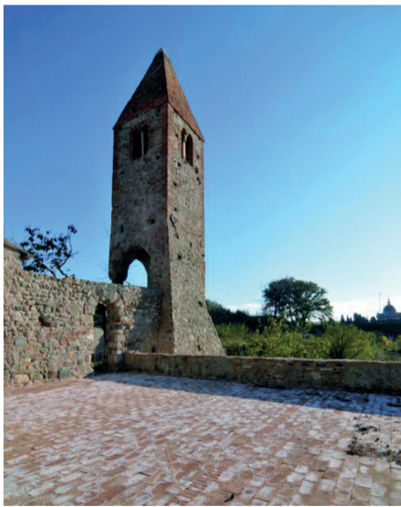
grafica: Daniele Pani

Monumenti parzialmente accessibili: 1, Itinerario 1