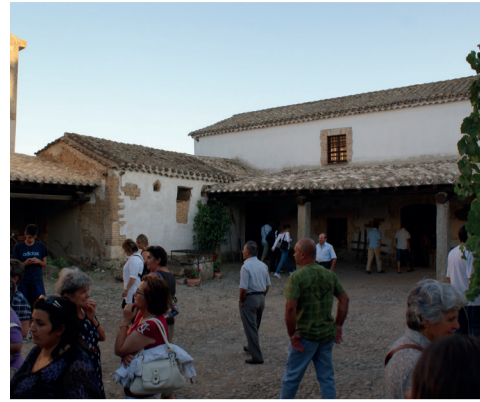
Chiesa di San Giovanni Battista 1 Via S. Giovanni 55