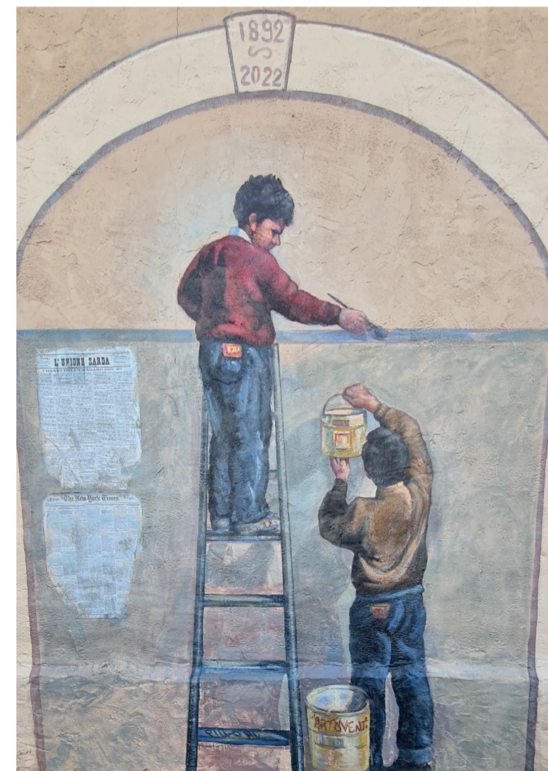
Murale "S'Unda Manna" 5 Via Monastir 8

S'Unda Manna, dipinto da Angelo Pilloni in via Monastir, ricorda la devastante alluvione che colpì il piccolo comune del Campidano. Con sessantotto vittime, trecento abitazioni distrutte e la perdita di enormi quantità di derrate alimentari, bovini e pecore, il murale trasmette un messaggio di rinascita e speranza. La linea azzurra tracciata dalla mano di un bambino rappresenta l'altezza raggiunta