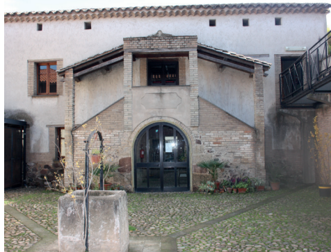
Museo del Crudo Via Roma 15