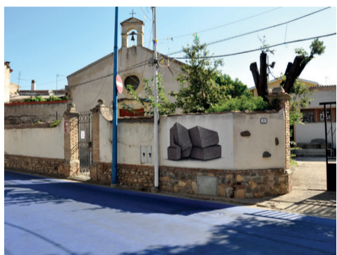
Chiesa di Santa Lucia 2 Via Decimo 1

Secondo clausole contrattuali del 1748, la villa viene ereditata solo dal ramo femminile della famiglia, che gestisce anche l'azienda agricola annessa. Di particolare interesse storico è il frantoio, realizzato alla fine del Seicento su due piani interamente in ladiri e restaurato nel 2000. Al piano terra, il frantoio conserva utensili antichi come la macina, la pressa e la tinozza, mentre gli orci con stemmi familiari del 1910 sono custoditi nel magazzino delle derrate. Una scala interna conduce al primo piano, dove venivano stoccate le olive prima della macinazione.