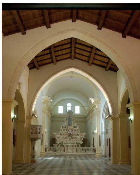
Parrocchia di San Sperate Martire

Il Museo del Crudo, situato in via Roma, è stato costruito su un lotto precedentemente occupato da una dimora seicentesca in ladini. L'edificio comprende due corpi separati da una corte quadrangolare e una seconda corte più piccola sul retro. Il corpo principale, su due piani, ha aperture su entrambi i livelli e una copertura a doppio spiovente. Le murature sono in terra cruda con profilature in mattoni cotti. L'accesso alla dimora avviene tramite un portale ligneo che conduce a un cortile pavimentato in ciottoli con un pozzo centrale. La struttura presenta elementi della tradizionale abitazione campidanese, ma con innovazioni che la avvicinano al palattu ottocentesco, come il prospetto finestrato e i due piani abitativi. Acquisito dal comune nel 1857, l'edificio divenne scuola e municipio. Negli anni '60, con il trasferimento delle scuole e degli uffici comunali, l'edificio fu abbandonato. Nel 1985, fu avviato un progetto di restauro per trasformarlo in un museo dedicato alla tecnologia della terra cruda, ma attualmente ospita mostre e convegni.