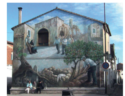
Murale "Il Santo Patrono" 6 Piazza Croce Santa

dall'acqua durante la tragedia, simbolo di vita e speranza. L'opera, realizzata negli anni '90, è stata restaurata in occasione dei centotrent'anni dall'evento, includendo dettagli delle testate giornalistiche che trattarono la vicenda, come L'Unione Sarda e il New York Times. La notizia dell'alluvione varcò i confini nazionali, apparendo su numerose testate internazionali, tra cui il Los Angeles Herald, The Morning Call, New York Tribune, El Siglo Futuro, El Isleno, The Daily Northern Argus, Leader, Rock Island Daily, e altre in Svizzera, Germania, Francia, Russia e Argentina.