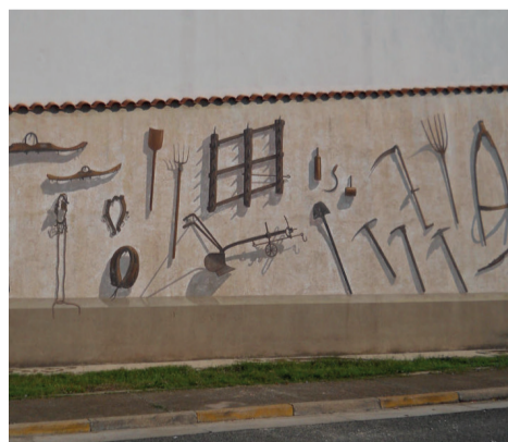
Murale "Alla Civiltà Contadina"

"La Preghiera" è un murale realizzato nel 2002 da Angelo Piloni. L'idea progettuale si rifà al celebre "L'Angelus", una delle opere più note di Millet, che raffigura una coppia di contadini che interrompono il duro lavoro dei campi al suono delle campane che annunciano l'Angelus, mostrati nella loro devozione, intenti nella preghiera. Non si tratta però di un semplice omaggio a uno degli artisti più amati dal muralista, ma di una trasposizione concettuale di un capolavoro dell'arte mondiale. La rilettura di Piloni, infatti, enfatizza gli elementi identitari con l'aggiunta del carretto col cavallo (tipica del mondo rurale campidanese) e il campanile appena riconoscibile sullo sfondo, che richiama la vicina chiesa parrocchiale di San Sperate. Ma se secondo le scoperte di Salvador Dali, nella versione originaria di Millet si sarebbe trattato di una veglia funebre per un bimbo depresso in una bara poi modificata in seguito ai ripensamenti dell'autore, nel murale speratino questo carico di tragedia è del tutto assente. A trasparire con forza è la composta dignità dei due astanti che affidano alla preghiera i loro sforzi e le fatiche quotidiane, nella solida speranza di un aiuto che garantisca di poter mantenere la famiglia.