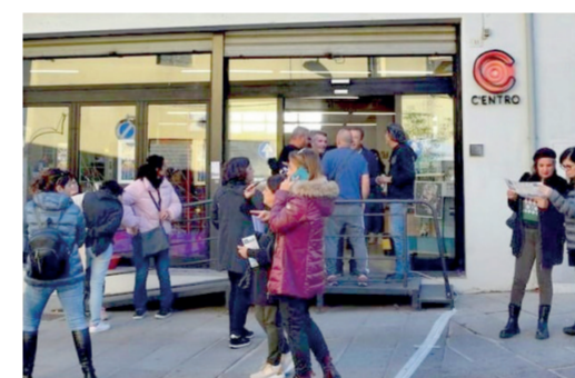
C'ENTRO Via Santa Croce 11

Il Museo del Calcio "Nuccio Delunas" nasce per custodire e valorizzare la memoria sportiva di San Gavino Monreale e dei suoi protagonisti. Al suo interno è esposta una ricca collezione di fotografie, maglie, trofei, cimeli e documenti che raccontano decenni di passione calcistica, dall'attività amatoriale alle grandi imprese delle squadre locali. Un percorso emozionante che rende omaggio a Nuccio Delunas, figura storica dello sport sangavinese, e a tutti coloro che hanno fatto del calcio un simbolo di appartenenza e comunità.