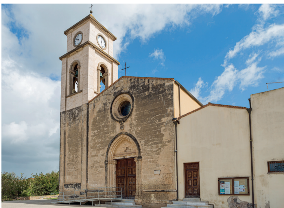
Chiesa Parrocchiale della Beata Vergine di Monserrato 2 Via Parrocchia

La facciata a capanna è distinta in tre stretti specchi da lesene e conclusa, all'apice, da campanile a vela a doppio fornice. Nello specchio centrale si apre il portale quadrangolare con lunetta a tutto sesto, impostata su protomi antropomorfe. L'interno conserva la scultura lignea del santo titolare e il mausoleo cinquecentesco del marchese Emanuele di Castelvi; questo, realizzato in marmo e trachite, propone la statua del defunto inginocchiato sul sarcofago in trachite, sorretto da due leoni in marmo bianco.