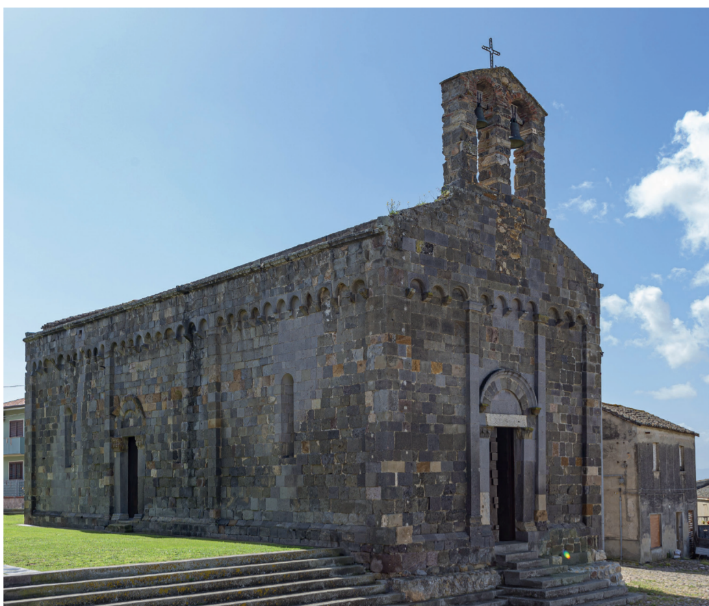
Chiesa di San Geminiano 1 Via S. Geminiano

L'antica chiesa romanica è dedicata al santo patrono del paese. Nonostante sia già menzionata nel 1118 come proprietà del monastero camaldolese dell'isola di Montecristo, mancano notizie certe riguardo la sua costruzione. Il tempio sorge su un sito funerario di epoca bizantina; si imposta su unica aula absidata con copertura lignea. All'esterno gli alzati, in conci di trachite scura, sono racchiusi da paraste angolari e scanditi da lisce lesene, mentre in alto corre continua una schiera di archetti pensili a tutto sesto su peducci. Su ogni specchio dei fianchi si aprono strette monofore, riproposte anche nell'abside semicircolare.