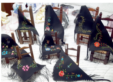
Casa Museo Chiara Atzori Via Diaz