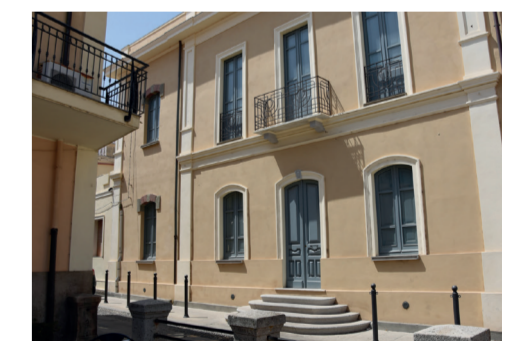
Casa Mereu 8 Via Diaz

L'Archivio Storico del Comune di San Gavino Monreale custodisce un patrimonio documentario di grande valore, composto da oltre 1600 unità archivistiche per un'estensione complessiva di oltre cento metri lineari. Conservato in un locale di recente costruzione, dotato di moderni sistemi antincendio e climatizzazione, l'archivio raccoglie i documenti prodotti e ricevuti dall'amministrazione comunale dal 1747 al 1967, insieme ai fondi di enti assistenziali, organi giudiziari, consorzi e associazioni confluiti nel tempo. Il lavoro di riordino e inventariazione ha reso questo patrimonio accessibile a studenti, ricercatori e appassionati di storia locale, offrendo una finestra preziosa sulla vita amministrativa, sociale e culturale del territorio. L'Archivio rappresenta oggi una vera e propria memoria storica collettiva, che racconta oltre due secoli di storia della comunità di San Gavino Monreale.