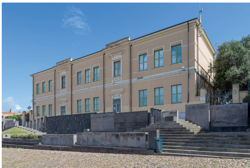
Edificio Storico della Scuola Primaria

La sacrestia e le cappelle laterali, oggi dedicate al Sacro Cuore di Gesù e alla Madonna di Bonaria, sono state costruite il secolo successivo con i soldi della popolazione. La chiesa presenta influenze greco-bizantine: possiede un'unica navata caratterizzata dalla volta a botte che nel 1956 fu arricchita da delle scene di vita di San Giuseppe, realizzate dal samasese Guglielmo Concu.