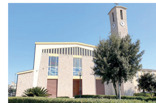
Chiesa di Santa Teresa del Bambin Gesù 6 Via Roma 255

La Chiesa di Santa Chiara fu edificata intorno al XV secolo e nel 1584 divenne parrocchia e fulcro della vita religiosa di San Gavino Monreale. Al suo interno si conserva un pregevole altare maggiore in marmo policromo, autentico gioiello artistico realizzato nel 1780 dallo scultore Michelino Spazzi e dedicato a Santa Chiara. Nel corso dei secoli, la chiesa ha accolto due cappelle dedicate alla Madonna delle Meraviglie e a Santa Maria Addolorata, oltre a sei cappelle laterali che presentano elementi decorativi riconducibili sia al gotico che al rinascimento. Un tempo, solo i nobili catalani avevano il privilegio di essere sepolti all'interno della chiesa, mentre il resto della popolazione veniva sepolto nel cimitero vicino alla Chiesa di San Gavino Martire. Nel 2021 la chiesa è stata oggetto di un importante intervento di restauro, che ha permesso la ricollocazione dell'antico retablo e dell'altare ligneo policromo, attribuito alla bottega di Michele Cavarò, nella loro sede originaria. L'altare è oggi ospitato nella suggestiva "Cappella delle Meraviglie", dove è tornato a essere parte viva della memoria e della devozione della comunità.