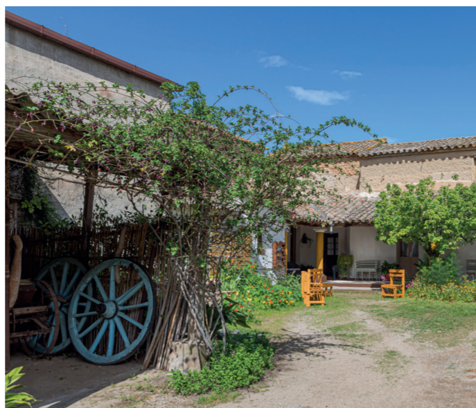
Casa Pau Via Piero Gobetti 2

L'edificio sorge sul terreno sui cui si trovava il vecchio convento agostiniano in località Su Conventu accanto alla Chiesa romanica di San Geminiano. Il caseggiato, disposto su due livelli, con 8 aule, venne costruito tra il 1913 e 1916 su progetto dell'ingegnere Dionigi Scano. È stato oggetto di restauri che in ogni caso hanno mantenuto l'impianto architettonico originale. L'edificio è censito nel Catalogo generale dei beni culturali.