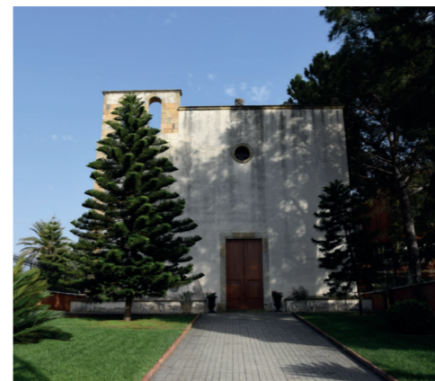
Chiesa di San Gavino Martire 1 Via San Gavino

L'interno appare semplice e modesto, presenta influenze greco-bizantine con una navata unica coperta con capriate lignee. Alla fine della navata è situato l'altare risalente al '700 in marmo intarsiato. Anticamente, il pavimento era in mattonelle sarde e il soffitto costituito da canne e tavole. Nel 2008 la chiesa è stata oggetto di un accurato restauro, che ha permesso di recuperare l'antico soffitto in legno e di restituire a nuova vita la pittura del loggiato esterno.