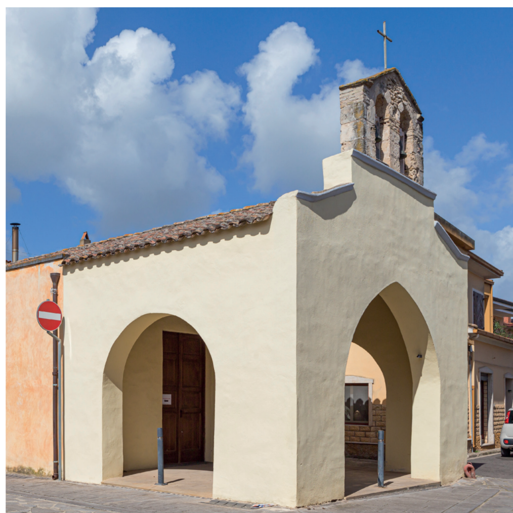
Chiesa di Santa Margherita 3 Via Santa Margherita 1

La Chiesa di Santa Margherita fu costruita nel 1725 con i lasciti della famiglia Setzu-Puxedu. A Samassi, la devozione popolare verso la Santa ha origini antichissime, in quanto le fu attribuita, grazie alla sua intercessione, la fine della pestilenza. La chiesa è situata nel centro storico. L'esterno dell'edificio è caratterizzato da un loggiato aperto sui tre lati: l'apertura frontale è detta a sesto acuto mentre le aperture laterali sono a tutto sesto. Sopra il portico è collocato il piccolo campanile a vela (unica parte originale) che oltre a impreziosire la facciata nella sua semplicità, ci fa intendere che in origine la chiesa era interamente in pietra.