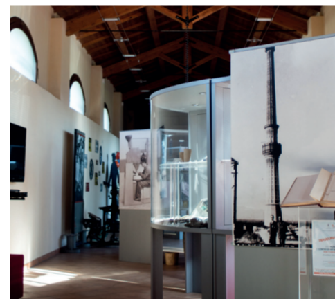
Museo Due Fonderie 2 Via Montevecchio