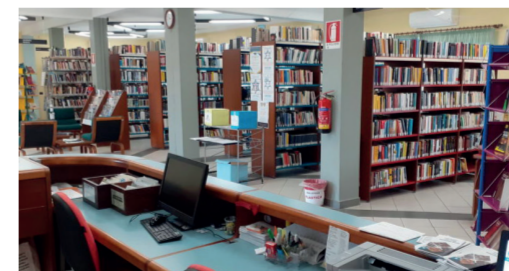
Biblioteca Multimediale "Faustino Onnis" 4 Via Leonardo da Vinci

Casa Dona Màxima, costruita nel XVI secolo dai feudatari spagnoli di Quirra, è una tipica casa padronale che conserva elementi architettonici della tradizione campidanesa, come "sa lolla" con gli archi e gli spazi di servizio disposti attorno al cortile interno. Deve il suo nome a Donna Massima Orrù, ultima esponente della nobile famiglia Orrù, che acquisì l'edificio dai Quirra nei primi anni dell'Ottocento. Nel 1856 fu presa in affitto dal Comune di San Gavino per ospitare l'Ufficio della Giudicatura Mandamentale, la Scuola Elementare Femminile e la Stazione dei Carabinieri Reali. Negli anni Settanta fu acquisita dall'Ente pubblico e restaurata per diventare una casa-museo. Dal 1994 ospita il museo etnografico, che raccoglie arredi, utensili della cultura campidanesa e reperti storici delle due Guerre Mondiali. Il piano terra ricostruisce fedelmente gli ambienti di una casa dell'Ottocento, mentre la mansarda è destinata a mostre ed esposizioni temporanee.