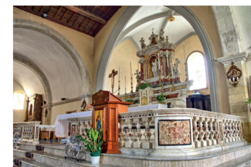
Chiesa di Santa Chiara 5 Piazza Marconi

L'ambiente interno, di circa 300 mq, è arredato in stile nord-europeo e ospita ampie sale per la consultazione. Oltre al prestito librario, la biblioteca mette a disposizione del pubblico anche strumenti e risorse multimediali, offrendo un servizio moderno e accessibile a tutte le fasce d'età.