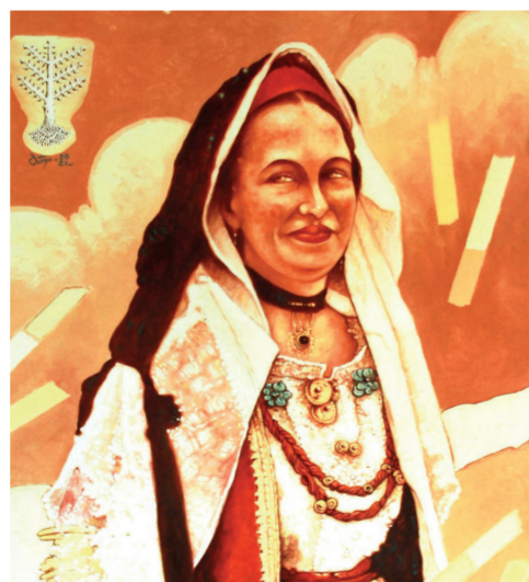
Galleria Civis Via Roma 102

Nel dopoguerra, la Fonderia divenne nota anche per la produzione dei pallini da caccia, utilizzati perfino durante i Giochi Olimpici. Pur avendo attraversato diversi periodi di chiusura e riorganizzazione, la Fonderia è ancora oggi attiva, a testimonianza della lunga storia industriale del territorio e del suo valore per la comunità di San Gavino Monreale.