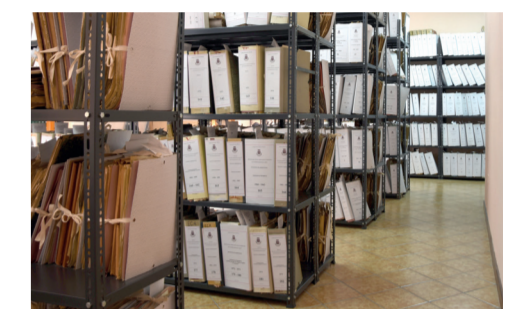
Archivio Storico 7 Via Trento

La Parrocchia di Santa Teresa del Bambino Gesù fu istituita ufficialmente il 1° luglio 1957 per volontà del vescovo Monsignor Tedde, in risposta alla forte crescita economica e demografica che San Gavino visse tra gli anni '50 e '60. L'edificio della chiesa fu costruito tra il 1966 e il 1968, mentre l'attività parrocchiale ebbe inizio il 28 settembre 1971. All'interno, sopra l'altare, si può ammirare un grande dipinto raffigurante Santa Teresa, opera di un artista sangavinese. In fondo, un imponente crocifisso con due angeli domina la scena. Sulla destra spicca la statua dell'Addolorata, incorniciata dallo sfondo sobrio delle pareti in pietra. Nelle cappelle laterali si trovano le statue della Madonna di Lourdes, dell'Immacolata, del Sacro Cuore, di San Giuseppe, di Santa Teresa, della Madonna del Carmine e della Madonna di Loreto. Nella piazza antistante la chiesa è collocata una statua di Padre Pio, simbolo di devozione e accoglienza.