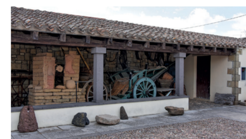
Casa Museo Dona Màxima 3 Via Amisora 21

Visite guidate a cura dell'Associazione "Sa Moba Sarda"