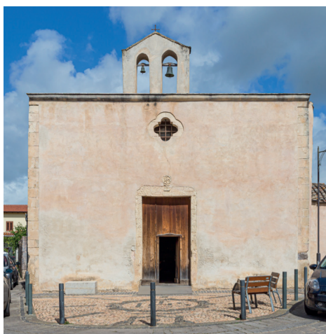
Chiesa di San Giuseppe Via San Giuseppe