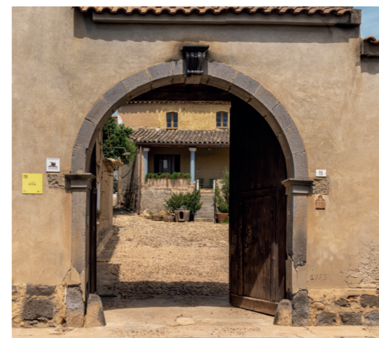
Casa Pittau Via Cagliari 15

Sul cortile si affaccia un importante loggiato, il cui lato frontale è rimasto intatto e nel quale si possono ammirare le caratteristiche colonne che lo delimitano, oltre alle porte della casa che su di esso si affacciano. Il tetto del loggiato poggia su travi di ginepro intagliato e presenta incannucciati a vista e una copertura di coppi sardi visibili dal cortile. La pavimentazione è di caratteristiche cementine bianche e rosse, che ne delimitano l'ampiezza e danno l'idea di un grande tappeto che abbraccia e riveste il pavimento. Nell'antica cucina si possono osservare il caratteristico caminetto e gli arredi tipici risalenti alla metà del secolo scorso: gli scanni, il tavolo con le sedie, una credenza.