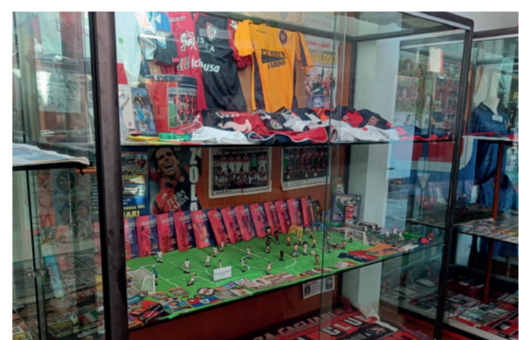
Museo del calcio "Nuccio Delunas" Via Convento

La Galleria Civis è uno spazio espositivo nato per sostenere e valorizzare le attività informative, culturali e sociali promosse dall'Amministrazione Comunale e dal vivace tessuto associativo sangavinese. Fin dal nome, il Centro Civis esprime la sua vocazione comunitaria e il suo ruolo come luogo di incontro, partecipazione e rafforzamento del senso civico. Dopo importanti interventi di recupero e riqualificazione, è stato inaugurato nell'ottobre 2011, diventando un punto di riferimento per eventi, mostre e iniziative dedicate alla cittadinanza.