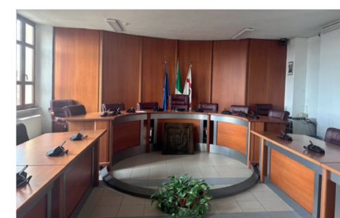
Sala Consiliare del Comune Piazza Marconi

il cuore pulsante della vita artistica di San Gavino Monreale. Il teatro, moderno e accogliente, ospita, durante l'anno, spettacoli, rassegne e incontri che coinvolgono attivamente la cittadinanza. Alle sue spalle, l'Anfiteatro all'aperto diventa palcoscenico estivo per concerti, performance e manifestazioni, incornicato da uno spazio urbano vivo e partecipato. In occasione di Monumenti Aperti, il complesso si apre al pubblico per raccontare la sua storia recente e il suo ruolo nella costruzione di una comunità culturale aperta e dinamica.