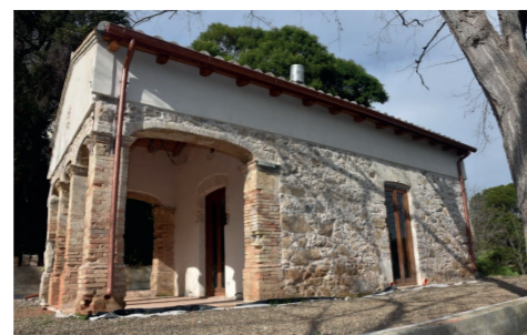
Parco di Lacuneddas 14 Angolo via Brabetza e via Bingiomigu

a quello della campagna, dai momenti di sva-