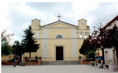
Chiesa Sant'Antonio 12 Piazza Sant'Antonio 1

Visite guidate a cura degli studenti dell'Istituto Comprensivo "Loru-Dessi" di Villacidro, con il supporto della Parrocchia di Sant'Antonio