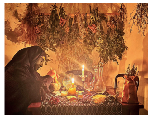
Sa Domu de Is Cogas 16 Via Scuole 89

stato acquistato e restaurato appositamente dopo i lavori di ristrutturazione della chiesa. La festa liturgica dedicata a San Pietro cade il 29 di giugno e nella chiesa campestre di Leni viene celebrata nel fine settimana più vicino a quella data.