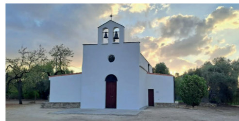
Chiesa di San Pietro di Leni 15 Loc. Leni - ex SS 196

polmone verde all'interno dell'abitato, presenta peculiarità paesaggistiche, con la sua flora e la sua fauna, la casa Alagna in stile liberty sardo, recentemente restaurata, e il particolare quanto inedito sistema idraulico di irrigazione formato da canalette in cotto per il trasporto dell'acqua collegate a più cisterne e pozzi posti sulla stessa linea, nella parte alta del podere. Un autentico gioiello da valorizzare e da restituire alla comunità villacidrese e sarda, dichiarato di «notevole interesse pubblico» già dal Ministero della Pubblica Istruzione con proprio decreto del 1° aprile 1963 e, più recentemente, anche dalla Regione Autonoma Sardegna, come specificato nel Piano Paesaggistico Regionale del 2013.