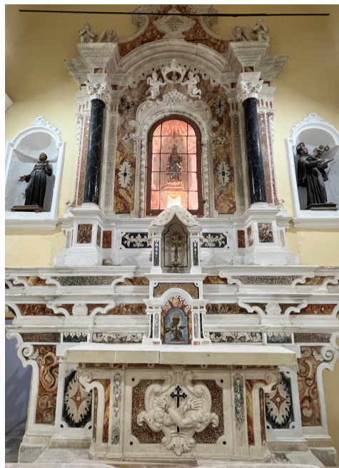
Chiesa di Santa Maria degli Angeli Piazza Convento