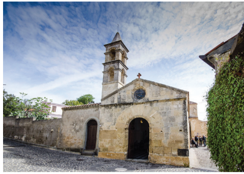
Chiesa di Santa Croce Via Asproni