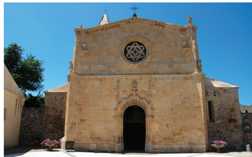
Chiesa Parrocchiale di Santa Giulia Via Nazionale

Realizzato nei locali dell'ex Monte Granatico, il museo civico archeologico è ricco di reperti prevalentemente di età punica e romana. Da segnalare il materiale prenuragico di cultura Abealzu-Filigosa, testimonianza della più antica frequentazione dell'area. Sono presenti alcuni pannelli illustrativi dell'antica Gurulis Vetus e della viabilità del territorio. Inoltre, è stata inserita una sezione dedicata agli scavi archeologici della adiacente Chiesa di Santa Giulia.