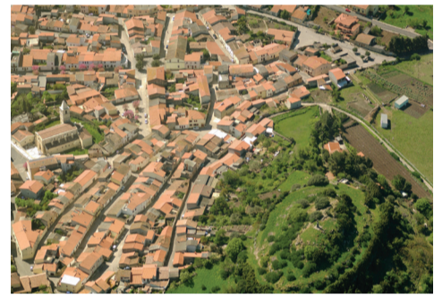
Parco dei Tre Colli Via Mario Pagano

La tipologia dell'edificio, le sue ridotte dimensioni, la modestia del prospetto a capanna, la configurazione planimetrica a navata unica con abside posteriore molto semplice, l'uso di murature "povere", costruite in pietra lavica e malta, inducono a pensare a una chiesa campestre costruita ai confini dell'abitato in epoca precedente a quella del convento francescano.