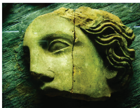
Museo Civico Archeologico Via Nazionale

Nei locali del Convento Franciscano è allestita un'esposizione di arredi, paramenti e prestigiosi argenti sacri appartenenti alla Chiesa parrocchiale di Santa Giulia. Tra i più significativi: un parato liturgico in seta bianca, una pianeta in seta rossa ricamata in argento e paramenti liturgici del '700 e dei primi dell'800, argenti di manifattura genovese quali l'Olea Sancta (la Teca degli oli Santi) la Croce processionale in argento del 1777, l'Ostensorio del Corpus Domini del 1782, la Corona e i Sandali d'argento della Vergine Assunta e la Croce astile in madreperla con incisi i Santi Francescani e i simboli della Passione.