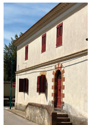
Casa Castiglia-Prunas Via Sulis 31

Distante meno di 1 km dal centro abitato, il nuraghe è formato da un corpo monotorre, mostra particolarità di rilievo, soprattutto per quanto attiene alla lavorazione dei blocchi e dalla loro disposizione. L'ingresso appare leggermente sopraelevato rispetto al piano di campagna. Sulla destra inizia la scala, sulla sinistra è presente una nicchia trapezoidale coperta a piattabanda.