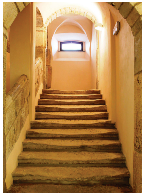
Convento Franciscano Piazza Convento