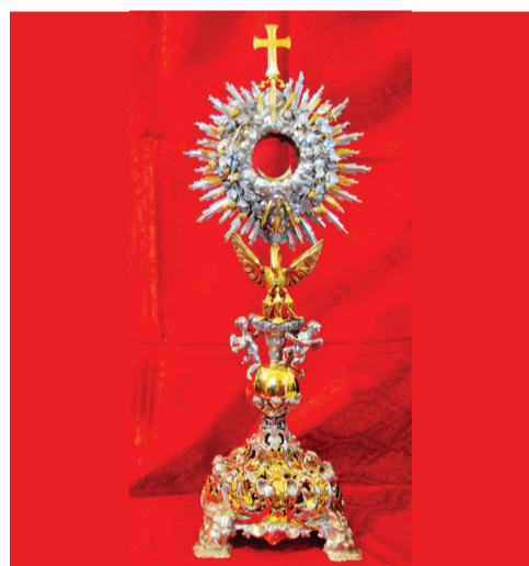
Mostra di Ornamenti Sacri all'interno del Convento Franciscano

Nei locali del Convento Franciscano è allestita un'esposizione di arredi, paramenti e prestigiosi argenti sacri appartenenti alla Chiesa parrocchiale di Santa Giulia. Tra i più significativi: un parato liturgico in seta bianca, una pianeta in seta rossa ricamata in argento e paramenti liturgici del '700 e dei primi dell'800, argenti di manifattura genovese quali l'Olea Sancta (la Teca degli oli Santi) la Croce processionale in argento del 1777, l'Ostensorio del Corpus Domini del 1782, la Corona e i Sandali d'argento della Vergine Assunta e la Croce astile in madreperla con incisi i Santi Francescani e i simboli della Passione.