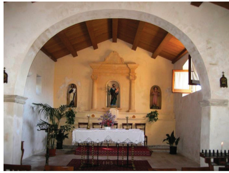
Chiesa di San Giuseppe Via E. D'Arborea 41

L'edificio, dedicato a San Michele Arcangelo, è ubicato nel versante settentrionale del centro abitato, ai piedi del colle di San Paolo, denominato anche Santa Rughe per la presenza, nella sua sommità, di una croce in ferro, da porre presumibilmente in relazione con il culto della Passione del Cristo praticato dalla stessa Confraternita. La zona riveste una grande importanza dal punto di vista archeologico in quanto punto nevralgico della città romana (Gurulis Vetus) di cui costituiva verosimilmente l'acropoli.