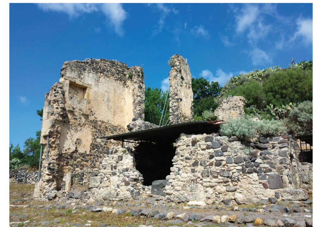
Complesso Archeologico di Palattu Loc. Colle San Paolo

sembra si uniformi a quella dominante della cattedrale di Alghero, maggiormente evidenziata nelle forme della struttura interna e nelle decorazioni che sovrastano il portale. Un'approfondita indagine archeologica testimonia quanto intensa e importante fosse l'attività di culto del paese.